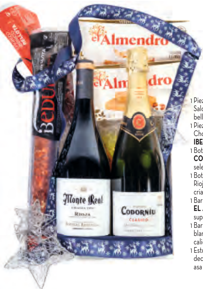
Estuche 707 24,43 € + I.V.A.