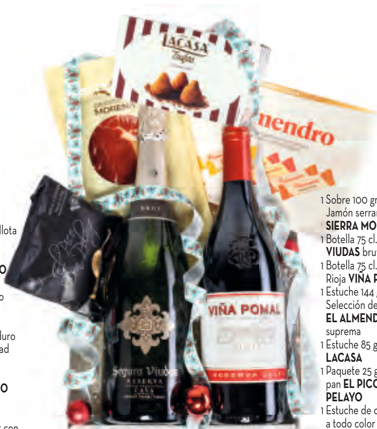
Estuche 708 26,15 € + I.V.A.