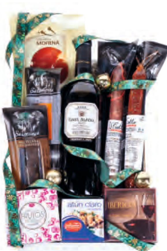
Estuche 706 22,61 € + I.V.A.