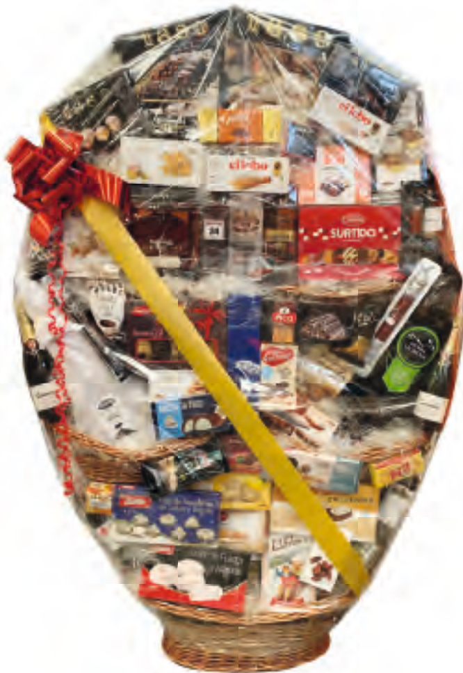
Muestra únicamente de presentación de la Cesta XXL, no de productos